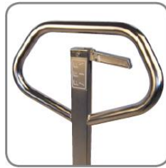
Az ergonomikus kormányrúd a felhasználó számára kényelmes fogást biztosít.

A készülékek a II. készülékcsoport berendezéseinek felelnek meg, és az 1. zóna / 21 zóna (beleértve a 2. zóna / 22. zóna) besorolású területeken való használatra engedélyezettek. Vagyis olyan területen, ahol arra kell számítani, hogy alkalmasszerűen veszélyes, robbanásveszélyes légkör alakul ki gázok elegeye vagy por miatt.