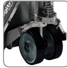
Az eszközöknek két antisztatikus Vulkanizált kereke van az elektrosztatikus töltés elkerülése érdekében