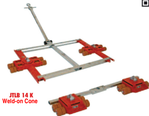
JTLB 14 K Weld-on Cone

konténerek mozgatásához 60 t teherbírásig, magasság 275 mm és 330 mm