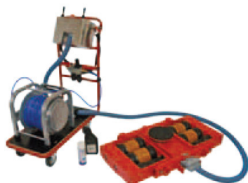
JLA Set 1

15 t teherbírás, 30 t vonszolt teher, magasság 180 mm