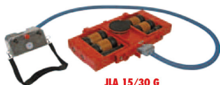
JLA 15/30 G

15 t teherbírás, 30 t vonszolt teher, magasság 180 mm