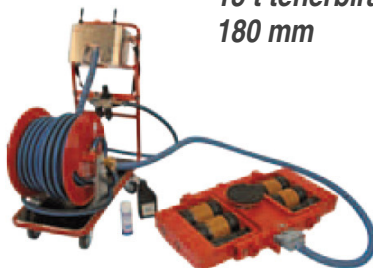
JLA Set 2