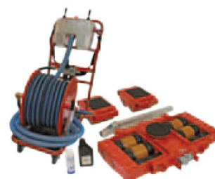
JLA Set 3