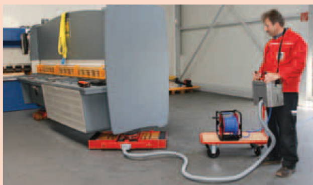
Vázlat JLA 15/30 G