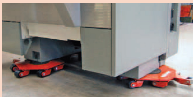
Vázlat JKB 7,5