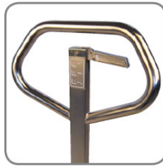
Az ergonomikus kormányrúd a felhasználó számára kényelmes fogást biztosít.

A készülékek a II. készülékcsoport berendezéseinek felelnek meg, és az 1. zóna / 21 zóna (beleértve a 2. zóna / 22. zóna) besorolású területeken való használatra engedélyezettek. Vagyis olyan területen, ahol arra kell számítani, hogy alkalmasszerűen veszélyes, robbanásveszélyes légkör alakul ki gázok elege vagy por miatt.