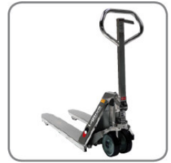
A robusztus konstrukció hosszú élettartamot és alacsony karbantartási költségeket garantál.