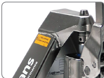
A robbanásbiztos eszközök alkalmasak a gyógyszeriparban, valamint a festék-, olaj- és gáziparban történő alkalmazásra.

II 2G Ex h IIB T6 Gb II 2D EX h IIIB T85°C Db