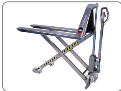
A standard készülékek kézi működtetésűek és rozsdamentes acélból készülnek.