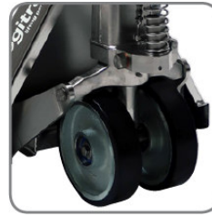
Az eszközöknek két antisztatikus Vulkollan kereke van az elektrostatikus töltés elkerülése érdekében.