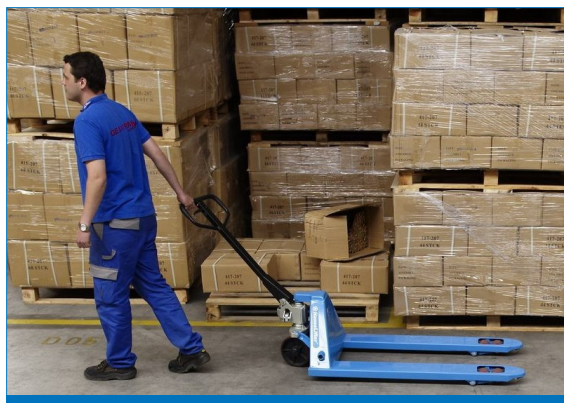
Villás kézi raklapemelő kocsi - praktikus segédeszköz minde raktárban.

A HanseLifter szívesen készít kimondottan az Ön igényei szerinti modelleket és átalakításokat - érdeklődjön!