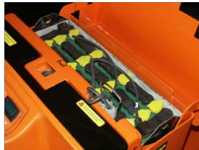
Nagy teljesítményű akkumulátor