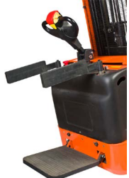
Plató és oldalsó támaszok