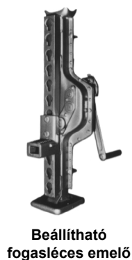
Beállítható fogasléces emelő